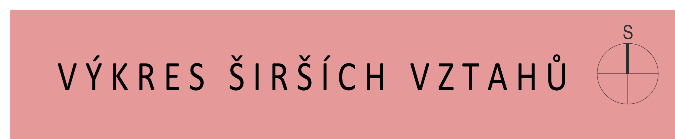
DETAIL KOORDINAČNÍHO VÝKRESU ÚZEMNÍHO PLÁNU