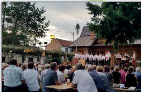
Předhodový večer V zahráděcce...