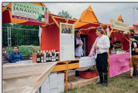
Vinaři na hradišti