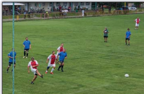
Těšice - Mikulčice, předhosový zápas v kopané