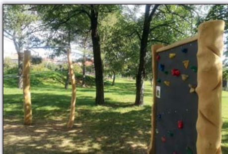
Nová lezecká stěna pro děti