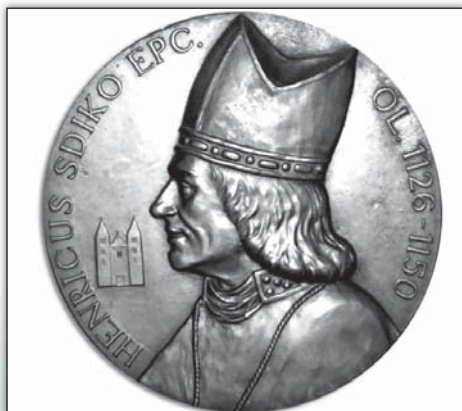
Olomoucký biskup Jindřich Zdík

Tento rok si připomínáme 880. výročí první písemné zmínky o naší obci v tzv. „ translační listině olomouckého biskupa Jindřicha Zdíka “. Latinsky psaná listina není datována, ale je většinou historiky přijímán rok 1141 , jako rok vydání tohoto významného dokumentu, který se řadí mezi nejvýznamnější dokumenty Moravy raného středověku (v některých starších pramenech se uvádí rok vzniku listiny 1131). S největší pravděpodobností jde o nejstarší pravou, v originále dochovanou listinu na našem území. Je napsána na pergamenu.