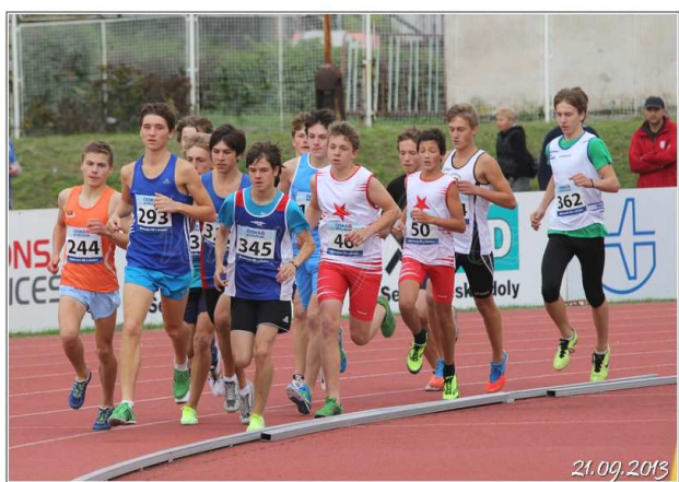
Mistrovství ČR žáků a žákyň na dráze–Praha