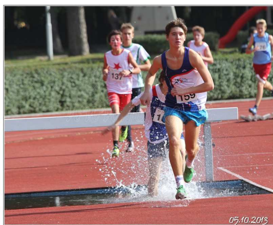
Mistrovství ČR družstev staršího žactva–Kladno