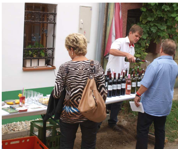
Víno a burčák z otevřených sklepů