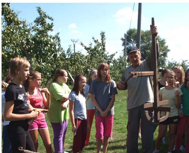
Exkurze u zahrádkářů