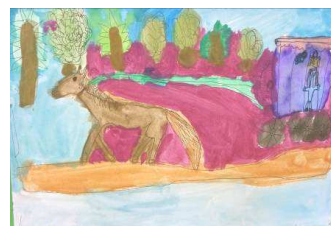
Dominika Turzíkova, 2.tř